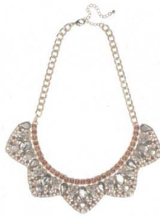
Marks & Spencer Limited Edition 系列假领项链