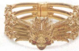
Alexander McQueen from Lane Crawford 手镯