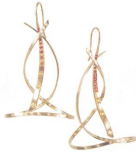
Cecile CHALVET 耳环