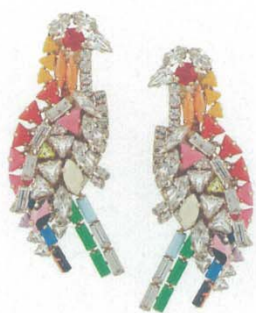
SHOUROUK Parrot 夹扣式耳环