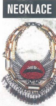
VENNA 项链 by Patrick Wong