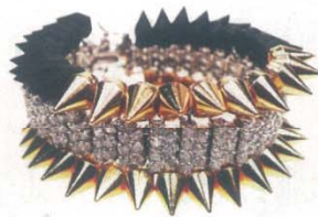
VENNA 手镯 by Patrick Wong