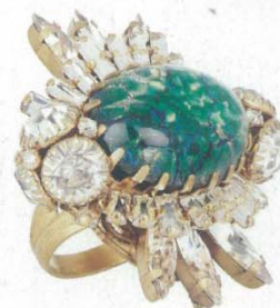
BIJOUX HEART 戒指

夸张的配饰作为服装的点缀和组成部分，具有很强的视觉效果和艺术感染力，让服装更有创新、灵活性。许多作为服装“点睛之笔”的饰件，更是服装艺术生命的关键。