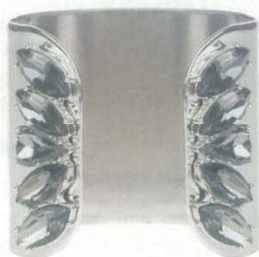
Marks & Spencer Limited Edition 系列手镯