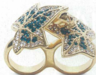
Alexander McQueen from Lane Crawford 戒指