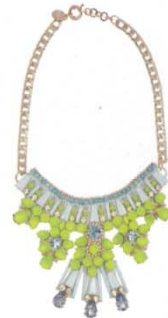
MATTHEW WILLIAMSON 项链