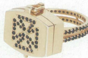
THIRTEEN31 Cross Poison 戒指