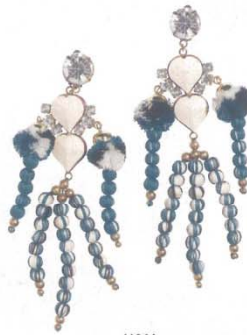
H&M Pompadour 耳夹