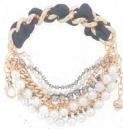
Juicy Couture 手链